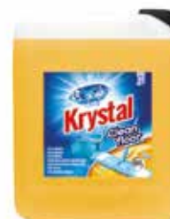
KRYSTAL na podlahy Alfaalkohol, 5 l 100009588