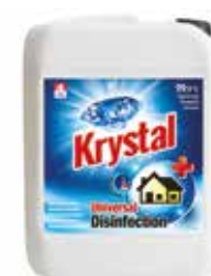
KRYSTAL univerzální dezinfekce, 5 l 100032207