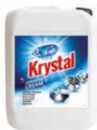
KRYSTAL tekutý písek, 6 kg 100000325