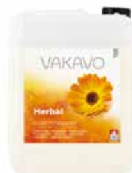
VAKAVO Herbal, tekuté mýdlo, 5 l 100026041