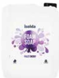
ISOLDA Violet energy, pěnové mýdlo, 5 l 100031827