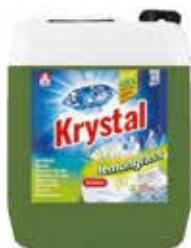
KRYSTAL na nádobí Lemongrass, 5 l 100009587