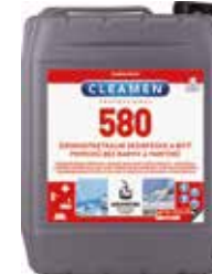
CLEAMEN 580 širokospektrá dezinfekce, 5 l 100032019