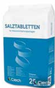
REGENERAČNÍ SŮL tabletovaná, 25 kg 100031201