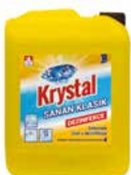
KRYSTAL Sanan Klasik, 5,5 kg 100000418